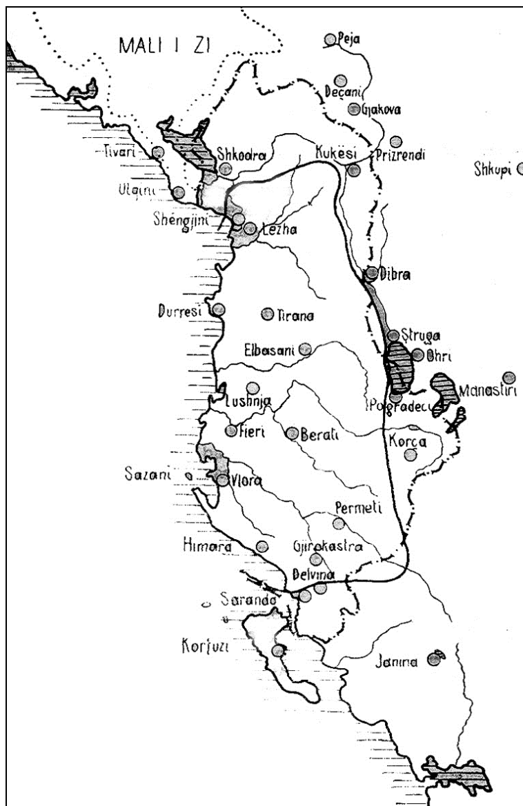
Kufijtë e Shqipërisë sipas projektit fillestar të Rusisë në Konferencën e Londrës (1912-1913)