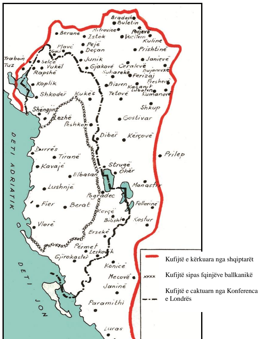
Hartë – Kufijtë e shtetit shqiptar në Konferencën e Ambasadorëve në Londër (1912-1913)

tëra pune, përpjekjesh e gjaku, mund të shkonin kot, të kishte në krah një fuqi si Perandoria Austro-Hungareze, për t'i dhënë mbështetjen që të përmbushte njerën pjesë të programit të rilindësve, krijimin e shtetit shqiptar të pavarur.