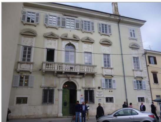
Fig. 4: Pallati Bruti në Koper (Slloveni), sot Biblioteka e qytetit.

Më tej ia vlen të përmendim ipeshkvin e Cittanovas në Istria Jacopo (Giacomo) Bruti (1628-1679), i cili vdiq më 1688. 74 Ipeshkvi tjetër i radhës i dalë nga kjo familje qe Agostino Bruti, ipeshkëv i Justinopolit (Capodistria/Koper) (ipeshkëv gjatë periudhës 28 shtator 1733 - tetor 1747).