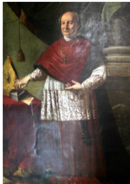
Fig. 3: Agostino Bruti

Në vitin 1571, Ulqini u pushtua nga osmanët dhe qe një ndër qytetet e fundit shqiptare që ranë nën sundimin e kësaj perandorie. Antonio Bruti u vra në luftë për mbrojtjen e qytetit të tij të lindjes që u mor pastaj nga turqit. 56 Edhe kunetërit e tij që i përkisnin familjes Bruni nuk patën aspak një fat më të mirë: Giovanni fillimisht u burgos nga turqit, por më vonë mesa duket u la i lirë, kurse Gasparo që u bë i dyti në komandën e aleancës detare të krishterë dhe u përball me flotën otomane në tetor 1571 57 , u vra në Betejën e Lepantos. Për trimëritë e tij qe shpërblyer duke u vënë në krye të një komande në fund të viteve 1570 për të mbrojtur enklavën papale në Avinjon, nga një tjetër armik heretik, kësaj here nga francezët protestantë huguenotë. Ai dërgoi djalin e tij, Antonion Brunin, në një shkollë jezuite në Romë ku studioi për drejtësi dhe që prej 1580 do të ndihmonte kushëririn e tij, Bartolomeo Brutin të administrojë Moldavinë. 58