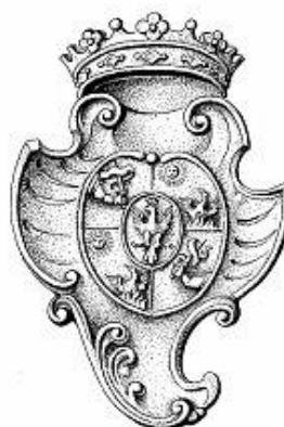
Fig. 1: Stema e familjes Bruti

Në Mesjetë, në lidhje me emrin Bruti apo Bruto gjejmë shumë persona që janë të dokumentuar me një mbiemër të tillë 1 sidomos gjatë shek. XV, por unë këtu do të trajtoj të dhëna rreth familjes fisnike Bruti me origjinë nga Shqipëria e Mesme, më saktësisht nga Durrësi 2 , siç e cilëson kështu edhe një “Relacion anonim mbi qytetin e rrethin e Ulqinit dhe mbi disa vende të tjera të Shqipërisë” i vitit 1571. 3 Familja Bruti është një ndër familjet me të shquara mesjetare