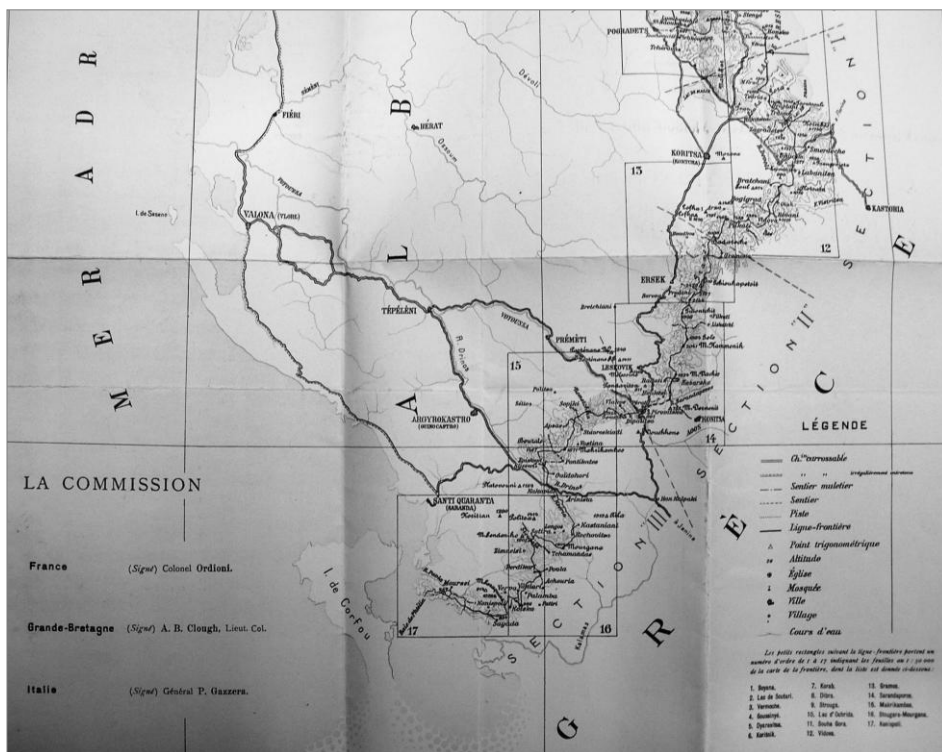
Protokollin përfundimtar i kufirit i vitit 1926 (PRO.FO.371.11203)

Historia e mësipërme tregon se çështja e kufirit tokësor mes Shqipërisë dhe Greqisë është një rast i mbyllur dhe i certifikuar prej më shumë se 90 vitesh. Në arkivat e diplomacisë perëndimore, gjendet i plotë dokumentacioni dhe hartat e sakta të Protokollit të Firences dhe vendimit të 30 korrikut 1926. Kjo është arsyeja që asnjë negociim rregullues nuk mund të zhvillohet mbi kufirin tokësor në mes Shqipërisë dhe Greqisë.