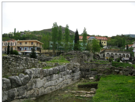
Fig 1. Mure të lashta të Lisit antik

Lezha shtrihet në veriperëndim të Shqipërisë midis ultësirës së Shkodrës dhe Bregut të Mates. Vendndodhja e saj midis kryeqytetit të vendit, Tiranës (rreth 55 km larg) dhe qytetit më të madh verior, Shkodrës (rreth 35 km larg) e bëjnë atë sot një qendër të rëndësishme transite. Qyteti, i cili në pamje të parë duket i ri, është shumë i lashtë,