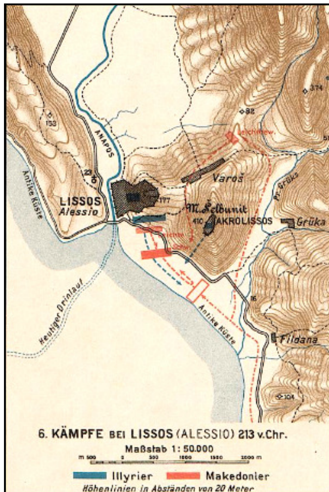
Fig. 4. Hartë që tregon luftën midis Filipit V të Maqedonisë dhe ilirëve në vitin 213 p. Kr.