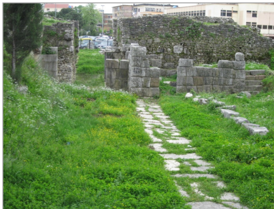
Fig. 3. Mure të lashta të Lisit, të periudhës së Antikitetit

Po nga Lisos, Dionizi nisi edhe komandantin e tij të këtij qyteti me trupa për të mbështetur farët helenë (banorët e qytetit Faros [sot Hvar në Kroaci]), të cilët në vitin 384 kishin themeluar një koloni në ishullin Faros (sot Lesina), ngaqë ishin sulmuar nga ilirët që jetonin në kontinent. 40