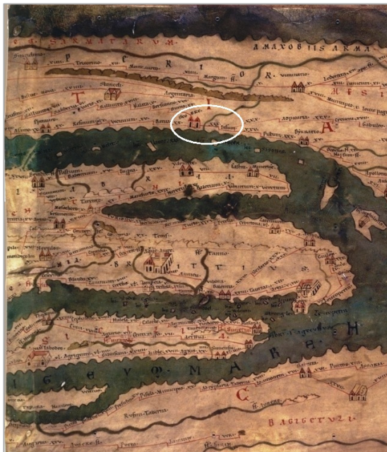
Fig. 5. Në rreth Skodra dhe Lissus në hartën Tabula Peutingeriana, shek. III-IV pas. Kr.

Burimi: Wien, Österreichische Nationalbibliothek (ÖNB): Bildarchiv, Cod. 324. Marrë nga: Euroatlas. URL: www.euroatlas.net